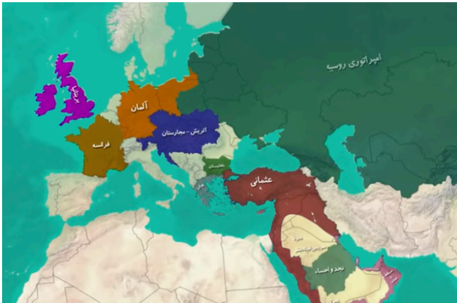
نقشه امپراطوری عثمانی در قرون ۱۹ و اوایل ۲۰