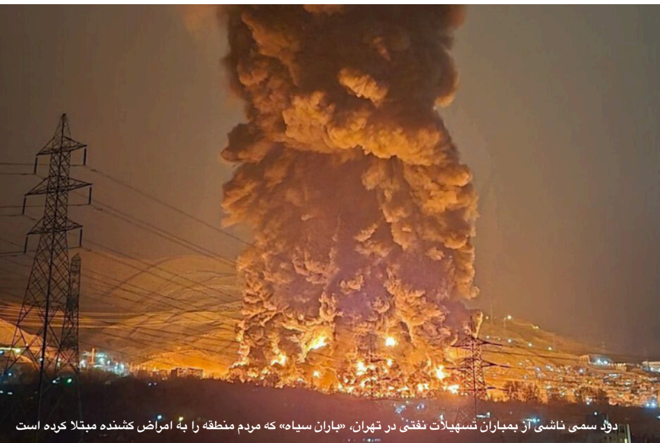
دود سمی ناشی از بمباران تسهیلات نفتی در تهران، «باران سیاه» که مردم منطقه را به امراض کشنده مبتلا کرده است

طنز تلخ اینجاست که ترامپ در نطق توضیحیش درباره تفاهمنامه در مقابل میلیون ها نظاره کننده، این مزدوران را