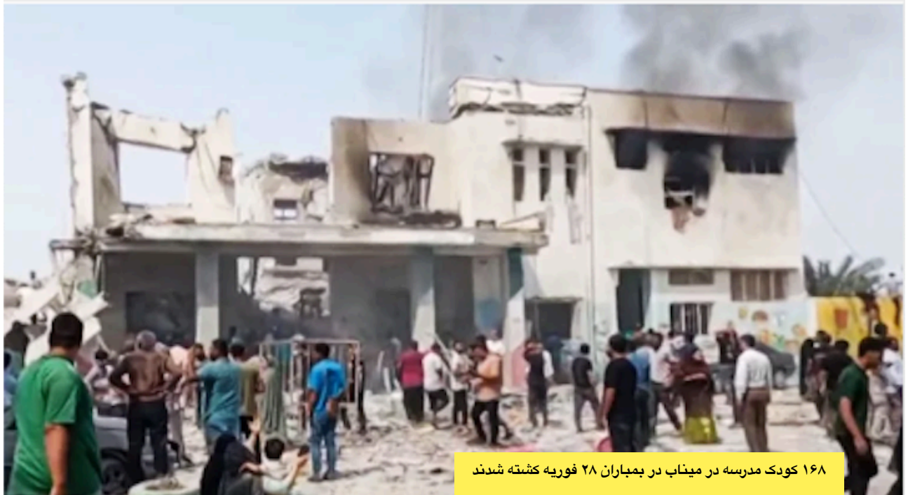
۱۶۸ کودک مدرسه در میناب در بمباران ۲۸ فوریه کشته شدند

حداقلی موجود در جامعه، از جمله آموزش و تفریح، برای خانواده‌ها به صفر می‌رسد. همه چیز بر عهده مادر خواهد بود. رژیم پیش از جنگ برای ازدواج‌های زودرس و فرزندآوری بیشتر بسیج شده بود. با شرایط پس از جنگ، زنان و دختران بیش از پیش در چنگال خانواده و ازدواج‌های زودرس قرار می‌گیرند.