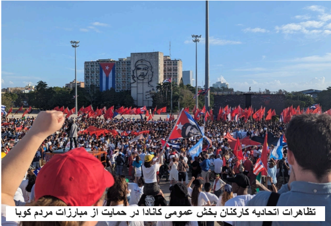
تظاهرات اتحادیه کارکنان بخش عمومی کانادا در حمایت از مبارزات مردم کوبا

تلاش‌ها، هر چند در بسیاری موارد در مقیاسی محدود انجام می‌شود، با ارسال کمک‌های انسانی و اقدامات نمادین می‌کوشد این محاصره را به چالش بکشد و نشان دهد که وجدان انسانی هنوز زنده است. بخش مهم دیگری از این همبستگی، اطلاع‌رسانی به افکار عمومی جهان درباره وضعیت دشوار و اسفبار مردم کوبا است؛ تلاشی برای آنکه رنج انسان در سکوت و بی‌خبری به فراموشی سپرده نشود.