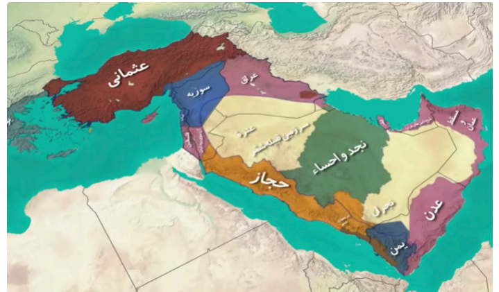
نقشه بعد از معاهده سور