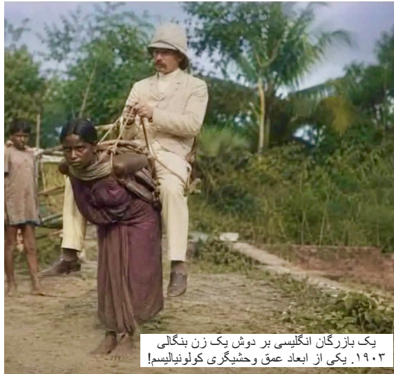
یک بازرگان انگلیسی بر دوش یک زن بنگالی یکی از ابعاد عمق وحشیگری کولونیالیسم! ۱۹۰۳.

قدرت های اروپایی در حالیکه با وحشی گری غیر قابل توصیفی بخش وسیعی از دنیا را تحت اشغال و تصاحب درآوردند، حدود ۶۰ تا ۱۰۰ میلیون انسان بومی در آمریکای شمالی و لاتین را به قتل رساندند. حدود سیزده میلیون انسان را در آفریقا اسیر کردند و در وحشیانه ترین شرایط به آمریکا منتقل نمودند. حدود دو میلیون نفر آنها در کشتی هایی که در آن به بند کشیده بودند، جان سپردند. نسل کشی های دولت های غربی بیشمار است. پادشاه بلژیک شخصا مسئول قتل ۱۰ میلیون انسان و نقص عضو میلیون ها انسان دیگر شامل کودکان در کنگو است.